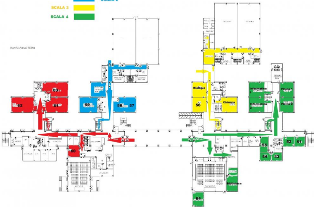
PANTA PIANO TERRA